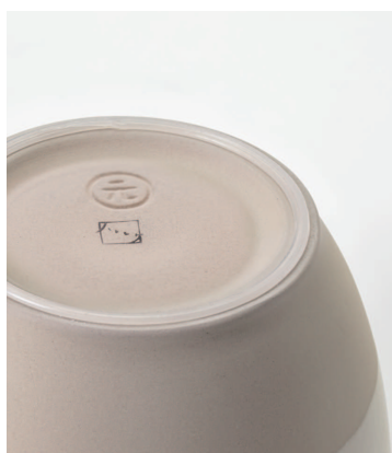
底面のシリコンが すべり止め+機の保護に